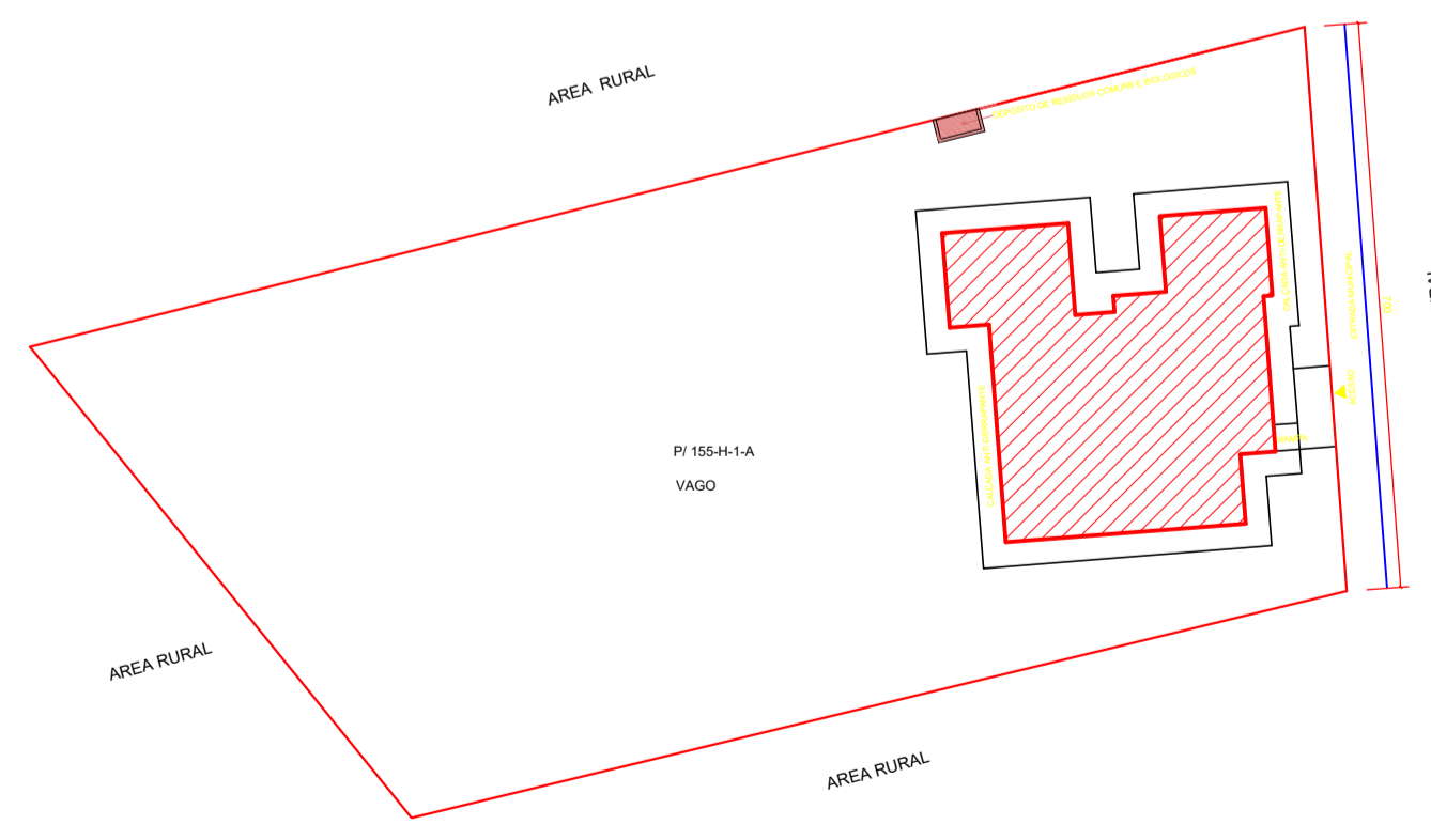
PLANTA DE SITUAÇÃO ESC. 1/500

OBS: EM TODA A PLATIBANDA SERÁ FEITO COLOCAÇÃO DE RUFO, ALGEROSA E CHAPIM CONFORME DETALHE 01